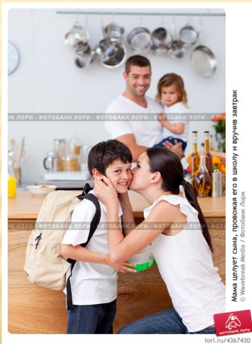
Мама целует сына, провожая его в школу и вручив завтрак